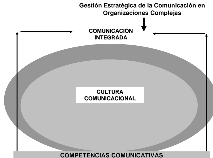
Fig. 1. Comunicación bajo una Perspectiva Compleja